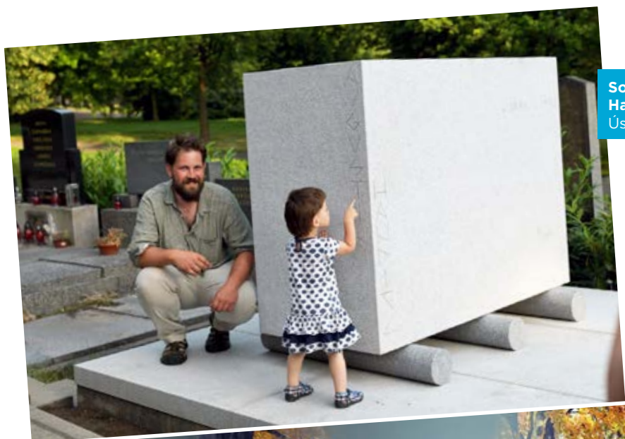
Sochař Jan Šnéberger je autorem památníku Augustina Handzela nazvaném Zastavený pohyb. Dílo je na Ústředním hřbitově Slezská Ostrava.

Ústřední hřbitov ve Slezské Ostravě je svou rozlohou 26,7 hektaru největším v Moravskoslezském kraji a třetím největším v ČR. Jeho součástí je také malá obřadní síň, budova oddělení hřbitovní správy a v areálu je i budova krematoria s velkou obřadní síní. Na ústředním hřbitově je v současné době 16 900 hrobových míst, z toho pouze 10 procent je nájemců z městského obvodu Slezská Ostrava. Největší podíl, 25 procent, tvoří nájemci z obvodu Poruba, 23 procent z obvodu Moravská Ostrava a Přívoz a 16 procent z obvodu Ostrava-Jih. To je také důvod, proč město Ostrava přispívá na údržbu hřbitova ročně částkou zhruba 8,3 mil. Kč. Z těchto finančních prostředků je následně hrazena údržba zeleně (6,3 mil. Kč) a zpevněných ploch (2 mil. Kč).