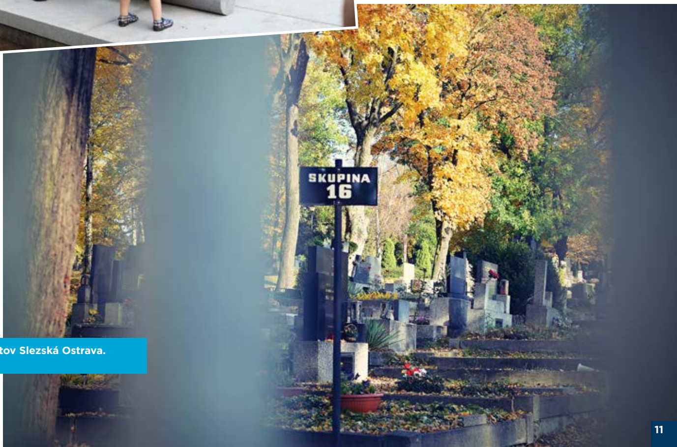
Ústřední hřbitov Slezská Ostrava.