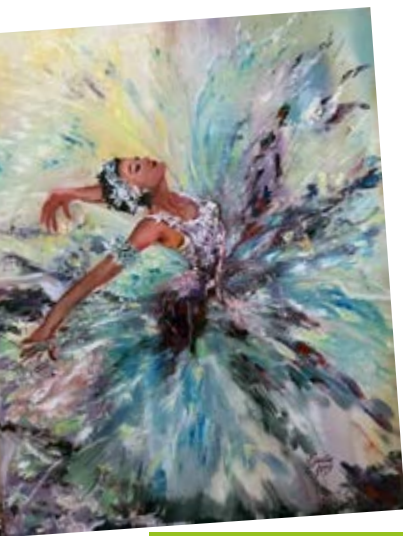
Díla Emilie Čečotkové