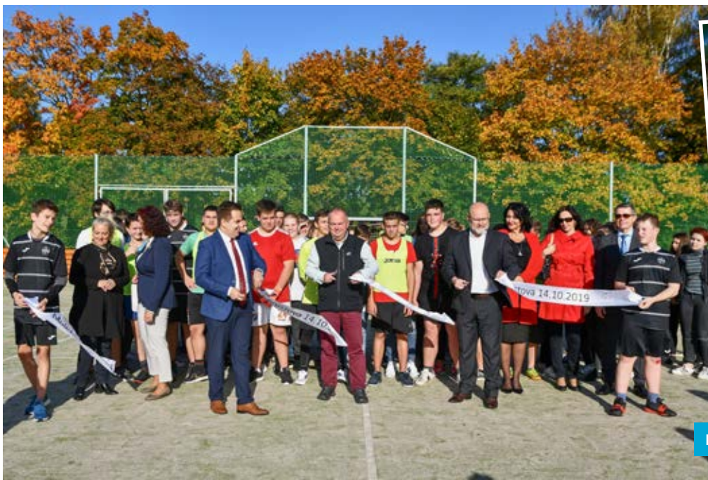
Rekonstruované hřiště ZŠ Chrustova