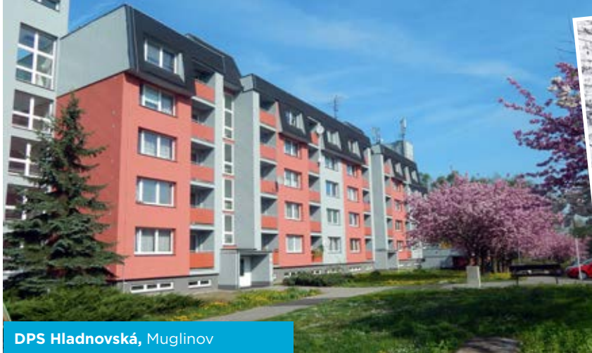
DPS Hladnovská, Muglinov