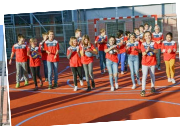
Rekonstruované hřiště ZŠ Pěší