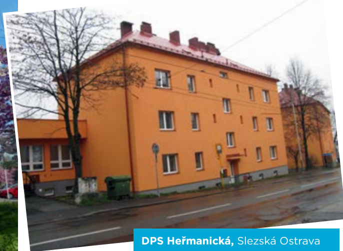
DPS Heřmanická, Slezská Ostrava